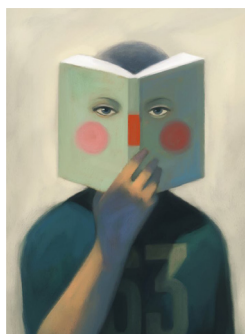
Gianni de Conno

Le terme «Arpentage» a vu le jour au sein de l'union nationale Peuple et Culture (réseau d'éducation populaire) à la fin des années 80.