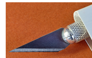
Le livre est découpé à part égale

Toute personne en mesure de rester concentrée 20mn sur un texte et volontaire pour écouter, prendre la parole dans un cadre constructif et bienveillant